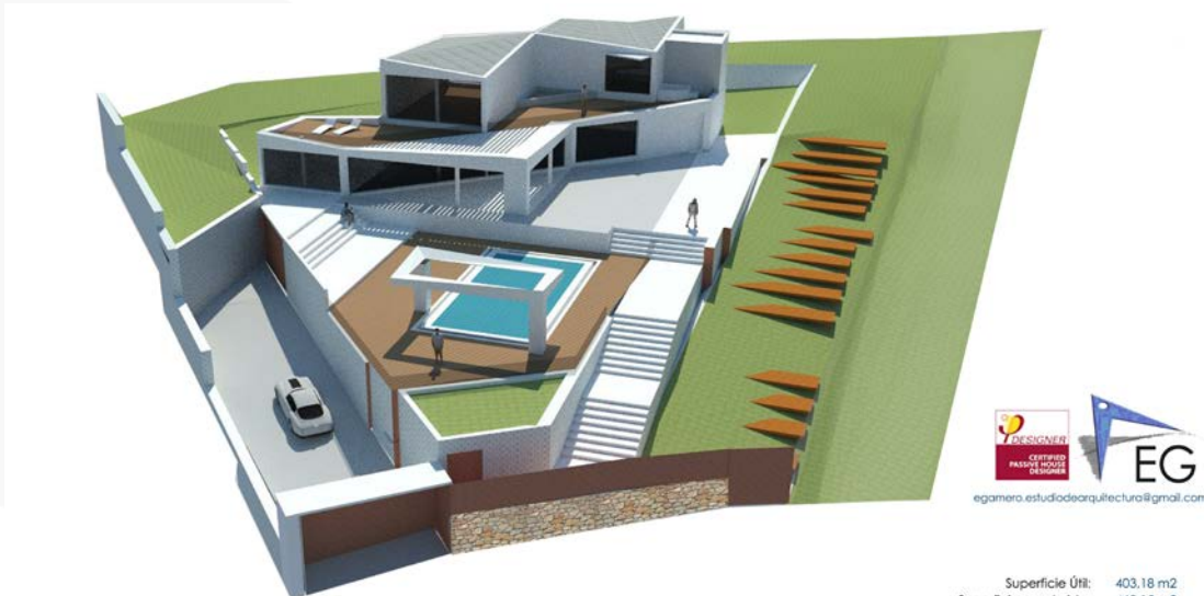
Vivienda Unifamiliar (5 dormitorios) en parcela S39. Urbanización Atlanterra, Tarifa (Cádiz)

La arquitectura se ha desarrollado con dos premisas proyectuales fundamentales: la orientación (se han conjugado las extraordinarias vistas al mar con las orientaciones solares más idóneas desde el punto de vista de arquitectura pasiva) y la accesibilidad (la vivienda cuenta con una rampa accesible que discurre por el interior de la vivienda desde la planta sótano hasta la planta primera).